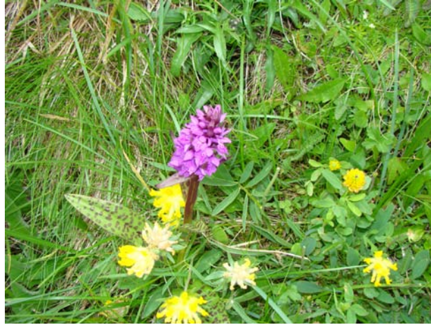
Storzyczek w TPN

Obszar województwa prawie w całości należy do dorzecza Wisły (zlewisko Bałtyku) oraz w niewielkim stopniu do dorzecza Dunaju (zlewisko Morza Czarnego). Wody przyporządkowane są do dwóch regionów wodnych Górnej Wisły i Czarnej Orawy. W okolicy wsi Piekiełnik przebiega dział wód Bałtyku i Morza Czarnego. Sieć rzeczną stanowią prawobrzeżne karpackie dopływy Wisły tj. Soła, Skawa, Raba i Dunajec z dopływami odwadniające obszar Beskidów i Pogórza i kształtujące zasoby wodne górnej Wisły. W porównaniu z innymi regionami Polski województwo małopolskie posiada dosyć bogate zasoby wód powierzchniowych (około 5 mld m 3 /rok). Około 78% wód płynących ma charakter górski o znacznym potencjale powodziowym. Województwo małopolskie należy do obszarów szczególnie zagrożonych powodzią.