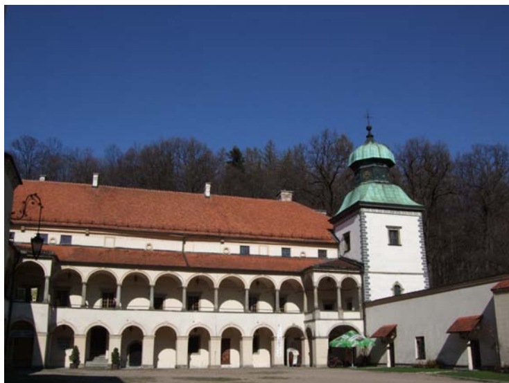
Zamek w Suchej Beskidzkiej

Ukształtowanie powierzchni ma charakter górski i wyżynny. Ponad 30% obszaru leży powyżej 500 m n.p.m. a tylko około 9% poniżej 200 m n.p.m., rozpiętość wysokościowa wynosi około 2 300 m, od 158 m n.p.m. położonej Wisły koło Słupca do 2499 m n.p.m. Rysy w Tatrach. Obszar obejmuje swym zasięgiem 5 mezoregionów fizyczno-geograficznych: Wyżyny Śląsko-Krakowskiej, Wyżyny Małopolskiej, Północnego Podkarpacia, Zewnętrznych i Centralnych Karpat Zachodnich. Rzeźba terenu jest niezwykle zróżnicowana: od wysokogórskiej, polodowcowej Tatr Wysokich, przez górską rzeźbę polodowcowo-krasową Tatr Zachodnich, średniogórską beskidzką, pogórską i wyżynną krasową aż po niziną Kotlin Podkarpackich.