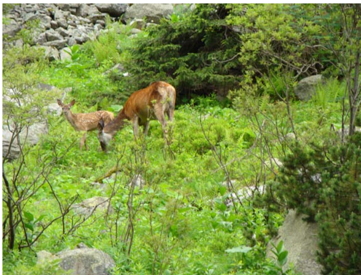
Tatrzański Park Narodowy

Stolicą województwa jest liczący około 759 tys. mieszkańców Kraków, drugie co do wielkości miasto w Polsce pod względem liczby ludności i wielkości powierzchni. Położony jest w dolinie Wisły, łącząc główne szlaki turystyczne i tranzytowe w Europie na osiach wschód-zachód oraz północ-południe. Należy do najpiękniejszych i najbardziej rozpoznawalnych miast na świecie. Będąc prawdziwym skarbem dziedzictwa kulturowego, zostało wpisane na pierwszą listę światowego dziedzictwa kulturowego UNESCO (podobnie, jak i 7 innych obiektów i zespołów obiektów na terenie województwa tj. Kopalnia Soli w Wieliczce, obszar byłych obozów zagłady Auschwitz-Birkenau, zespół klasztorny OO. Bernardynów w Kalwarii Zebrzydowskiej oraz 4 gotyckie zabytki architektury drewnianej – kościoły w Binarowej, Dębnie, Lipnicy Murowanej i Sękowej).