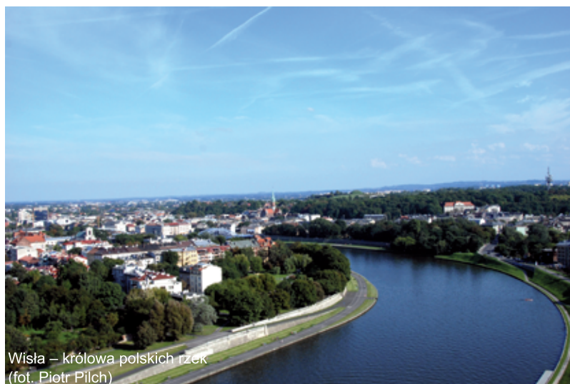
Wisła – królowa polskich rzek