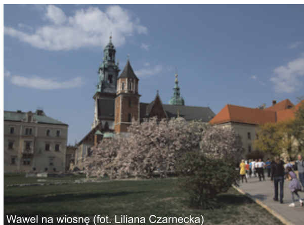
Wawel na wiosnę

Zróżnicowanie regionalne warunków klimatycznych pokrywa się z zasięgiem występowania podstawowych jednostek fizjograficznych, tj. Wyżyny Śląsko-Krakowskiej, Wyżyny Małopolskiej, Północnego Podkarpacia, Zewnętrznych Karpat Zachodnich, Centralnych Karpat Zachodnich. Pod względem klimatycznym w tym obszarze wyróżnia się co najmniej trzy regiony klimatyczne: wyżyn środkowopolskich, kotlin podkarpackich i samych Karpat. Masy powietrza napływają głównie z kierunków zachodnich oraz z południa i południowego